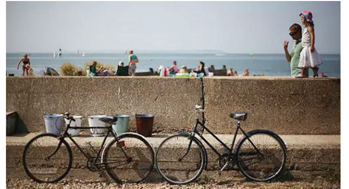
乘坐東方快車，從英國肯特郡的鄉間出發，直抵海濱城市惠茨特布爾

乘客用餐時，會有一群樂手漫步在他們身邊，演奏小夜曲。從羅馬湖觀光到巴斯日間探險，這兩條基於美食的特色列車路線，都是要抵達特定目的地的日間遊。此外，還有一條更具有東方快車色彩的特別旅行——即普爾曼號上的兇殺神秘午餐。