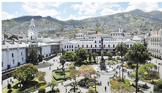
歷史名城 厄瓜多爾首都基多是巡遊列車安第斯山脈旅程的起點

對任何一位交通規劃人員來說，厄瓜多爾的安第斯山脈都是一道令人頭疼的難關：三英里（約4828米）高的山脊縱貫厄瓜多爾的中心地帶，延展成高原，裂出峽谷，遮蔽雲霧繚繞的古老城鎮。一百年前，這裏築起鐵路的時候，世人都將其稱為技術奇蹟。