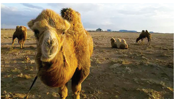
蒙古縱貫鐵路穿越戈壁沙漠

有些鐵路因取道旖旎的自然美景聞名遐邇。有一些則因為上下穿行於皚皚雪山而備受青睞。但卻很少有人質疑西伯利亞鐵路統領所有兩線分支鐵路的至尊地位：作為列車旅行中的龐然大物，它橫跨的區域範圍之廣讓人難以想像。旅客們在終點站下車時，這輛隨著轟鳴聲的火車伴已載著他們走完五分之一地球周長的距離。