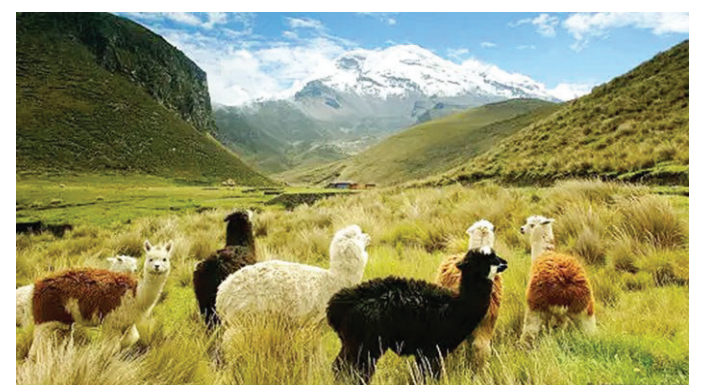
在到達太平洋沿岸之前，搭乘的巡遊列車會經過厄瓜多爾最高峰——欽博拉索山

霧林裏的亞馬遜舒阿爾族人舉辦一場盛會。夜幕降臨時，旅客們會走下火車，在睡前欣賞傳統大莊園，並享用當地美食。