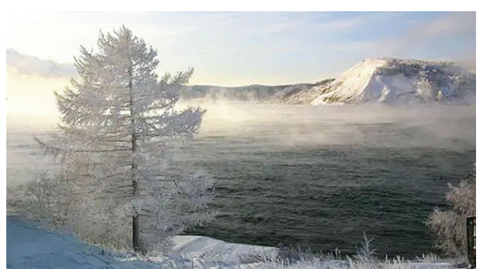
在一路向南的西伯利亞鐵路上欣賞貝加爾湖