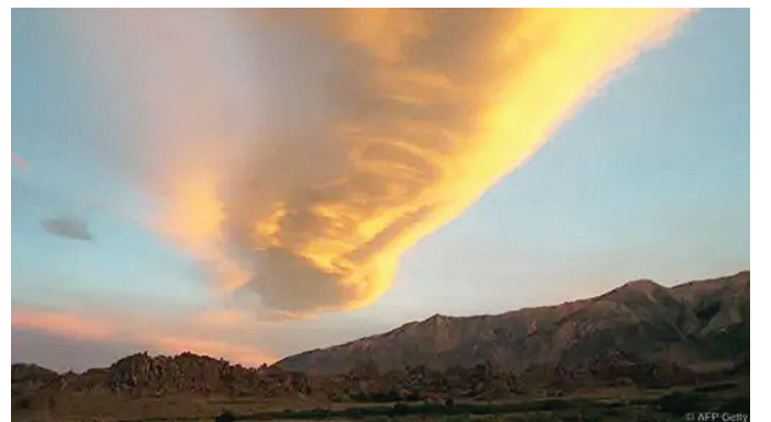
內華達山脈是微風號列車到達舊金山之前的最後一個精彩景點。

賞到這種過目難忘的美景。令人目眩的內華達山脈隘口是在到達舊金山和太平洋之前的最後景點，也為這段橫越全國的冒險劃上了完美結點。