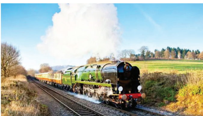
全速前進 英國普爾曼蒸汽列車特色之旅，讓你在薩里郡風光地走一遭

「鐵路的終點……是我們走向榮譽和未知的大門。」1910年，小說家E.M.福斯特這樣寫道，字裏行間反映了上下班高峰期，乘客旅客對火車旅行的一點浪漫幻想。但火車旅行確乎一度成為帶著魅力與冒險的華麗願景，更不用說車上的那些高級餐廳、豪華裝修和優質服務了。