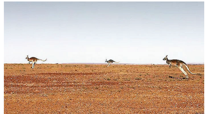
內陸居民的大汗號豪華列車的路線之旅

靠站點都是下車擁抱美景的好機會，你既能跟著嚮導漫步其間，又能搭乘直升機俯瞰全景。甚至還有機會體驗阿富汗快車（大汗號列車舊稱）的原型——即騎著駱駝、穿越沙漠。