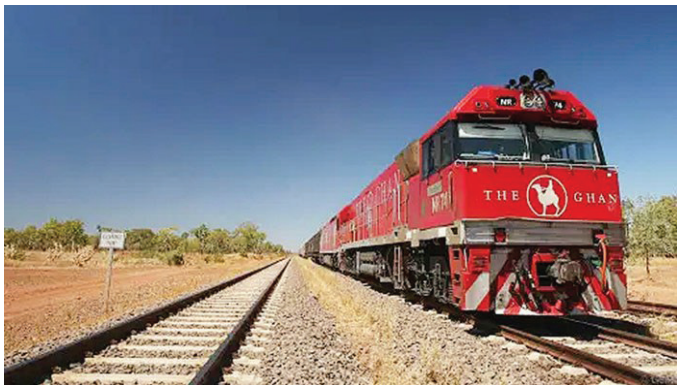
荒林之美 大汗號列車路線連通著達爾文港和阿德萊德之間3220公里長的澳大利亞腹地

澳大利亞內陸是一片讓人琢磨不透的地方：這片廣闊區域的圖樣傳唱在原住民的歌聲裏，而不是繪在紙上。乘駱駝穿行其間之前，這裏對歐洲移民而言就是一片神秘之境。紅土中心、無人之境、極地盡頭，這些模糊不清地名界定，聽來亦是神秘而遙遠。而今這裏能夠貫通火車已屬奇蹟；再加上穿行這片異界極地上的列車又豪華非凡，一切真就像糕點上的點綴物，不可多得。