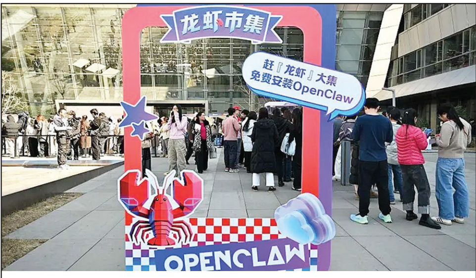
2026年3月11日，在北京百度總部，人們排隊等待安裝開源人工智能助理 OpenClaw