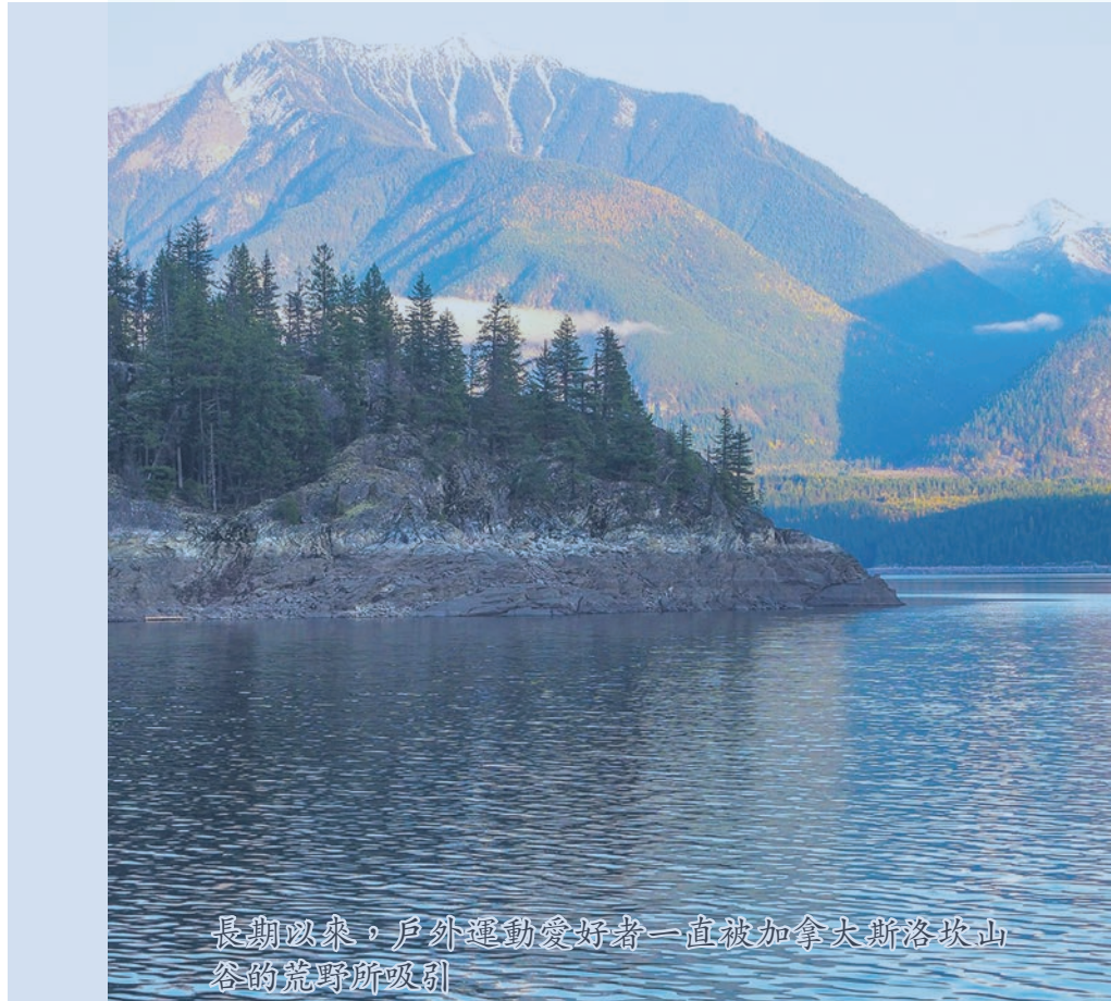
長期以來，戶外運動愛好者一直被加拿大斯洛克山谷的荒野所吸引。