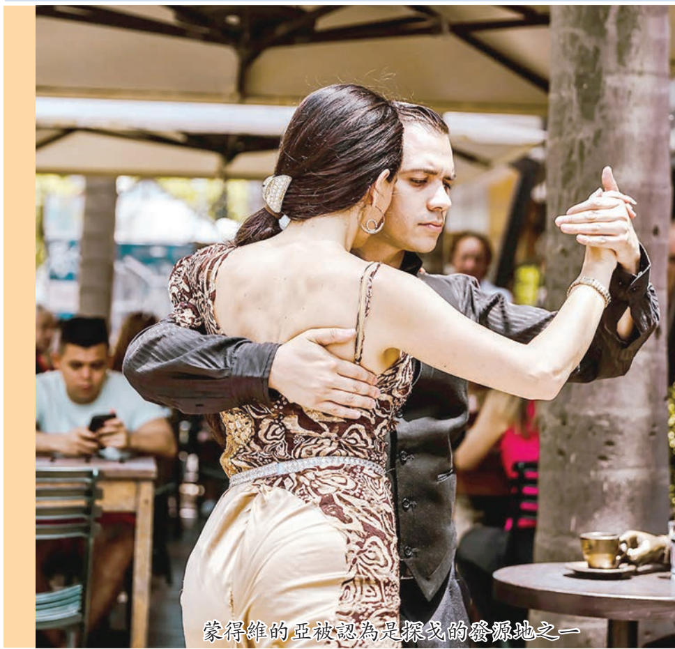
蒙得維的亞被認為是探戈的發源地之一