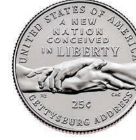
Gettysburg Address Quarter