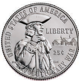
Revolutionary War Quarter