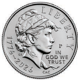
Emerging Liberty Dime

雖然明年不會有新的一分錢投入流通，但美國鑄幣局將推出一款紀念美國建國 250 週年的紀念版一分錢，供大眾購買。