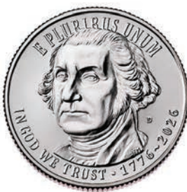
Revolutionary War Quarter