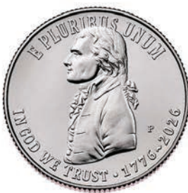
U.S. Constitution Quarter