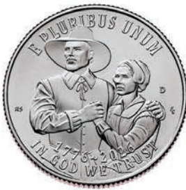
Mayflower Compact Quarter