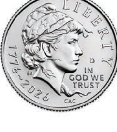
Declaration of Independence Quarter