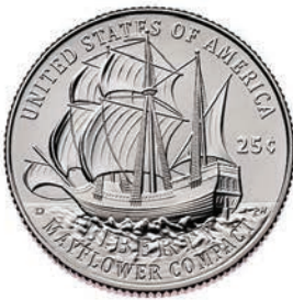
Mayflower Compact Quarter