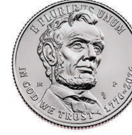
Gettysburg Address Quarter