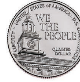
U.S. Constitution Quarter