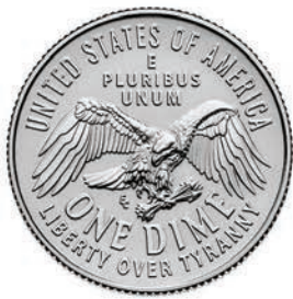
Emerging Liberty Dime