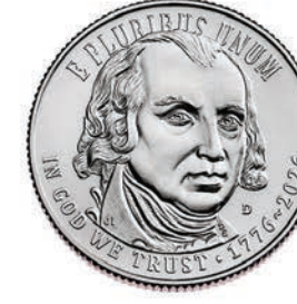
U.S. Constitution Quarter