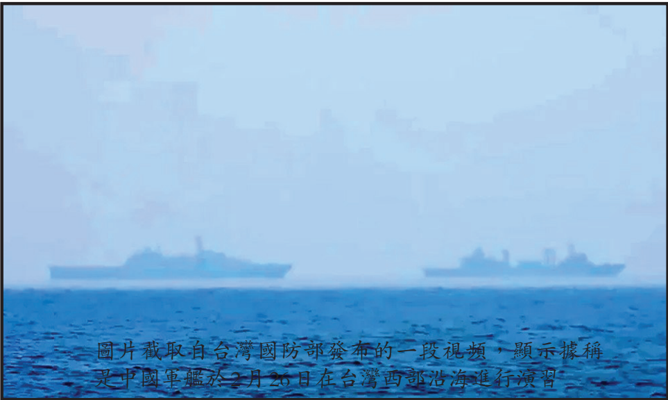
圖片截取自台灣國防部發布的一段視頻，顯示據稱是中國軍艦於2月26日在台灣西部沿海進行演習

顯然，這種象徵意義並非巧合：「中國捍衛主權的立場一個世紀以來始終未變，」中央電視台發布的一篇貼文寫道。(CNN)