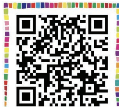
付款計畫額外資訊