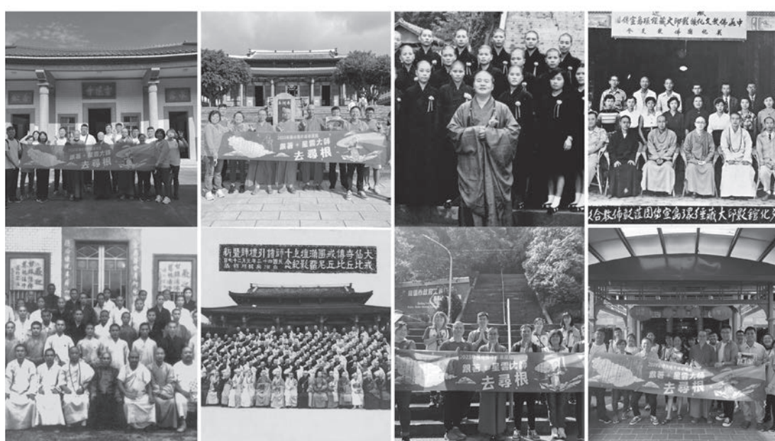
佛光青年追尋星雲大師弘法足跡，騎機車環島完成參學壯遊。